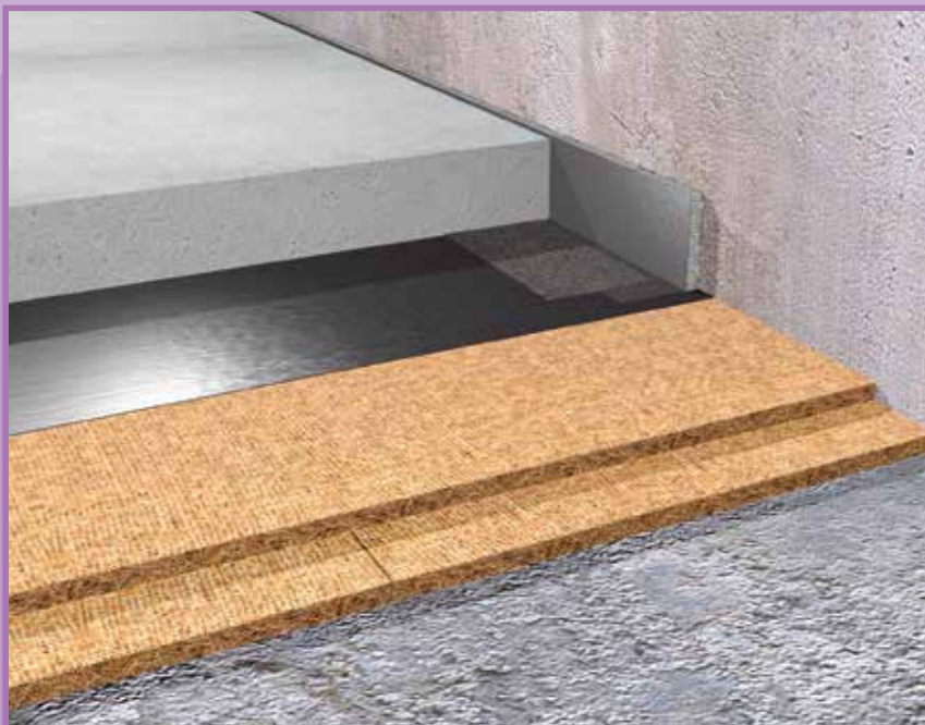
Nevidek kokos 300 op ruwe bouwvloer.

Nevidek kokos 300 wordt toegepast in ruimtes met te verwachten hoge belastingen (tot 1000 kg/m 2 ) zoals horeca, discotheken,